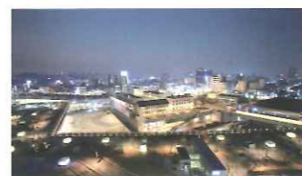
国立アジア文化殿堂(ACC)

文化や芸術が豊かな都市 光州は、様々な形態の芸術を生み出した。その結果、政府はアジア各国と文化的な繋がりや対話の場を形成するために「アジア文化センター都市プロジェクト」に着手したのである。光州は韓国の伝統的な絵画、民俗音楽、詩、洋画、中国現代音楽などの分野で様々な著名人を輩出し「芸術家の都市」として広く知られているのである。