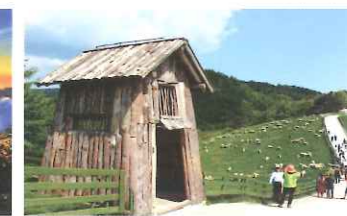
雪岳 & 大閔嶺観光特区