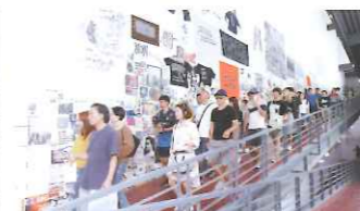
光州ビエンナーレ