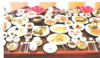
全羅道地域の季節の味

光州は肥沃な全羅道地方の中心に位置しており、全国最高の食材を一所に集め、最高の味をプレゼントする。