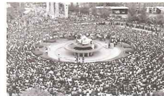
518民主化運動アーカイブ (UNESCO世界記録遺産)