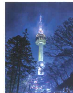
(左から時計回り) 南山タワー 景福宮 光化門