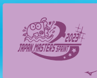
84ピンク マーク:ブルー