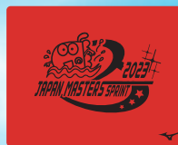
62レッド マーク:ブラック