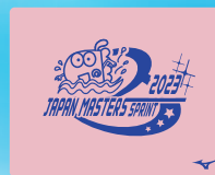
68ラベンダー マーク:ローズ