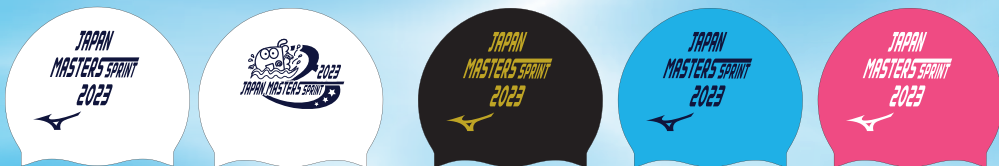
01ホワイト マーク:ネイビー