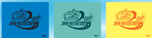
27ブルー マーク:ブラック