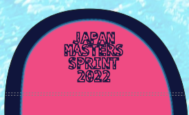
64ローズ×ネイビー マーク:ネイビー/ステッチ:ターコイズ