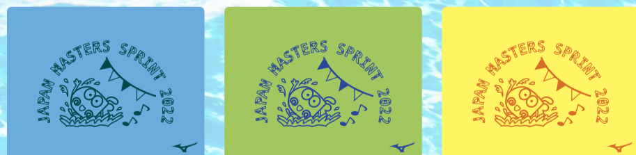
19サックス×グリーン