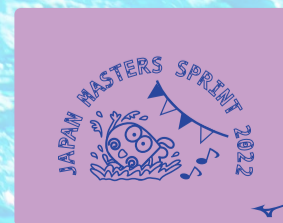
68ラベンダー×ブルー