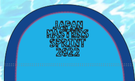
24ターコイズ×ブルー マーク:ブラック/ステッチ:ローズ