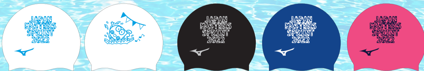
01ホワイト×ブルー ×ブルー