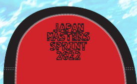
62レッド×ブラック マーク:ブラック/ステッチ:ホワイト