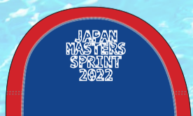
27ブルー×レッド マーク:ホワイト/ステッチ:ホワイト