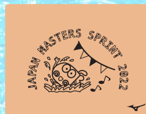
53オレンジ×ブラック