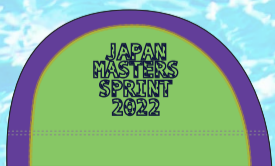
36ライム×バイオレット マーク:ネイビー/ステッチ:イエロー