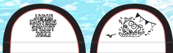
01ホワイト×ブラック マーク:ブラック/ステッチ:レッド