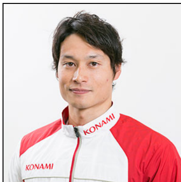
50mバタフライ 元日本記録保持者

～正しいスタートはベストタイムへの第一歩～ 国内 TOP クラス選手によるスタート・ターン・泳法ワンポイントレッスンです。