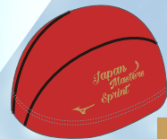
102 62レッド×ゴールド ゴールド2