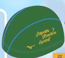
37Lグリーン×ゴールドイエロー JAMBOWくんイメージカラー