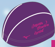
29 69バイオレット×ローズ ローズ