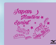
68ラベンダー×ローズ