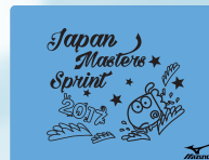
19サックス×ブラック