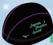
09ブラック×ライトエメラルドグリーン