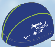
01 19ブルー×ホワイト ホワイト