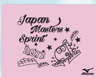
84蛍光ピンク×ブラック