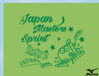
31ライトグリーン×グリーン