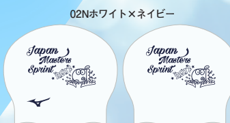
02Nホワイト×ネイビー