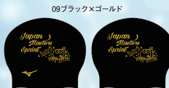
09ブラック×ゴールド