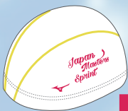
30 01ホワイト×Nレッド Nレッド