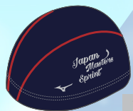
100 14ネイビー×シルバー シルバー